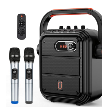
5. マイク・スピーカー