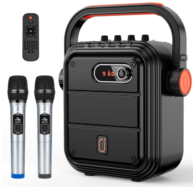
スピーカー・マイク